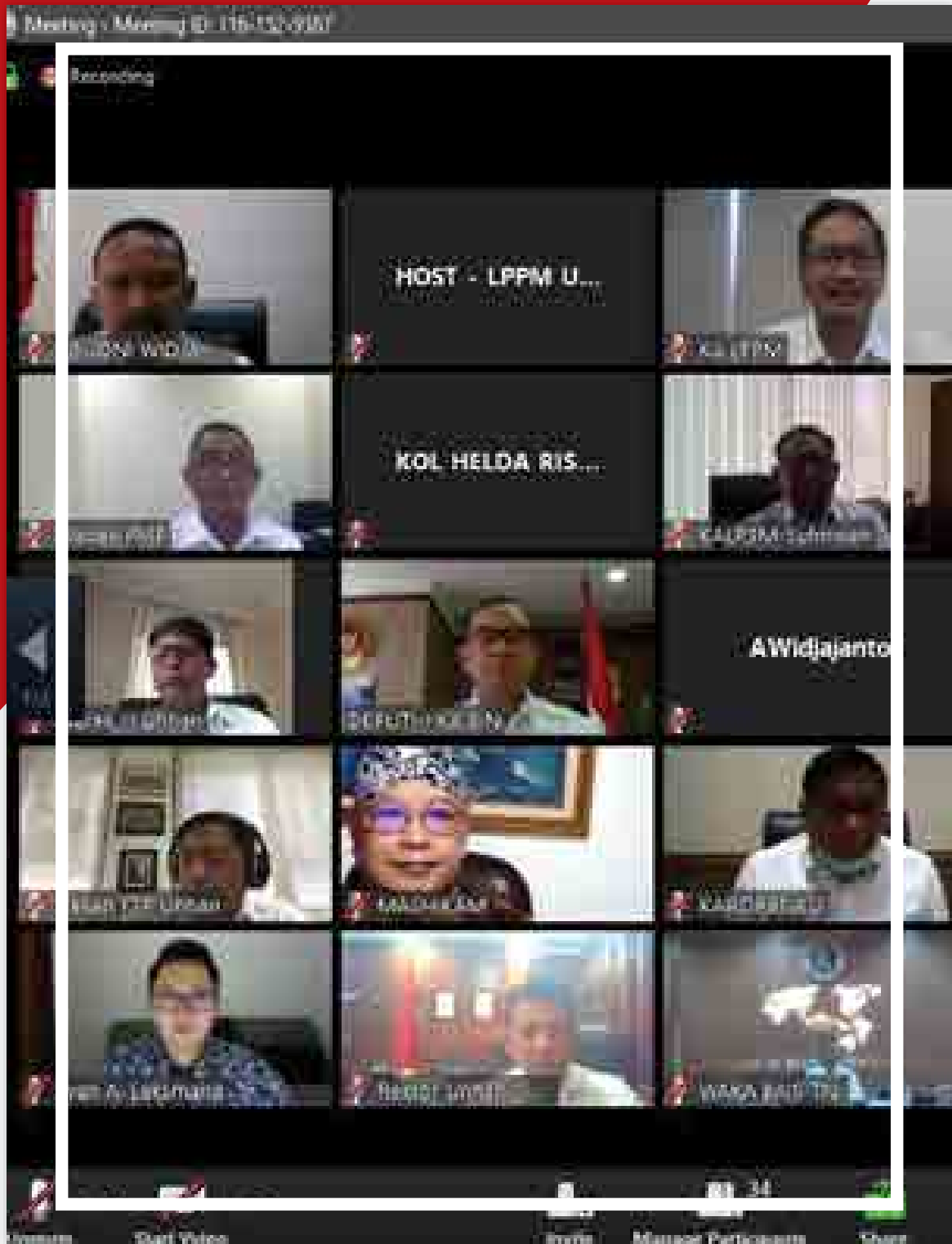
Unhan Melaksanakan Berbagai Focus Group Discussion FGD Secara Daring