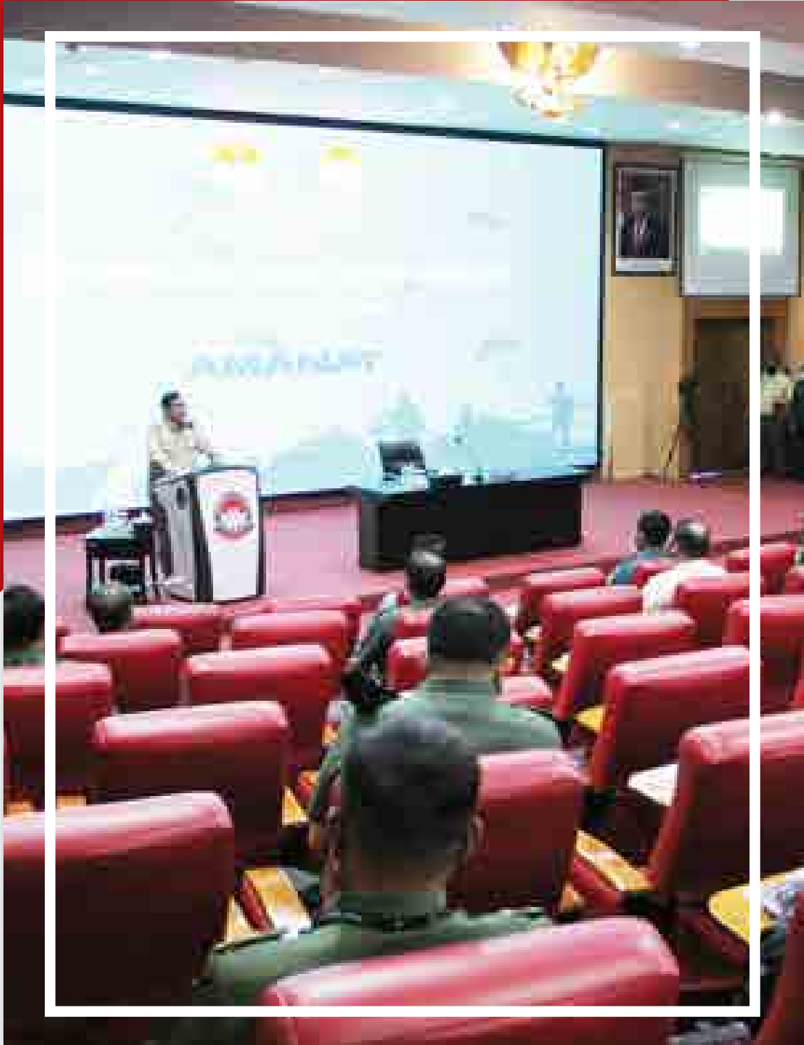
Unhan Menyelenggarakan Short Course "On Warfare and Strategy"