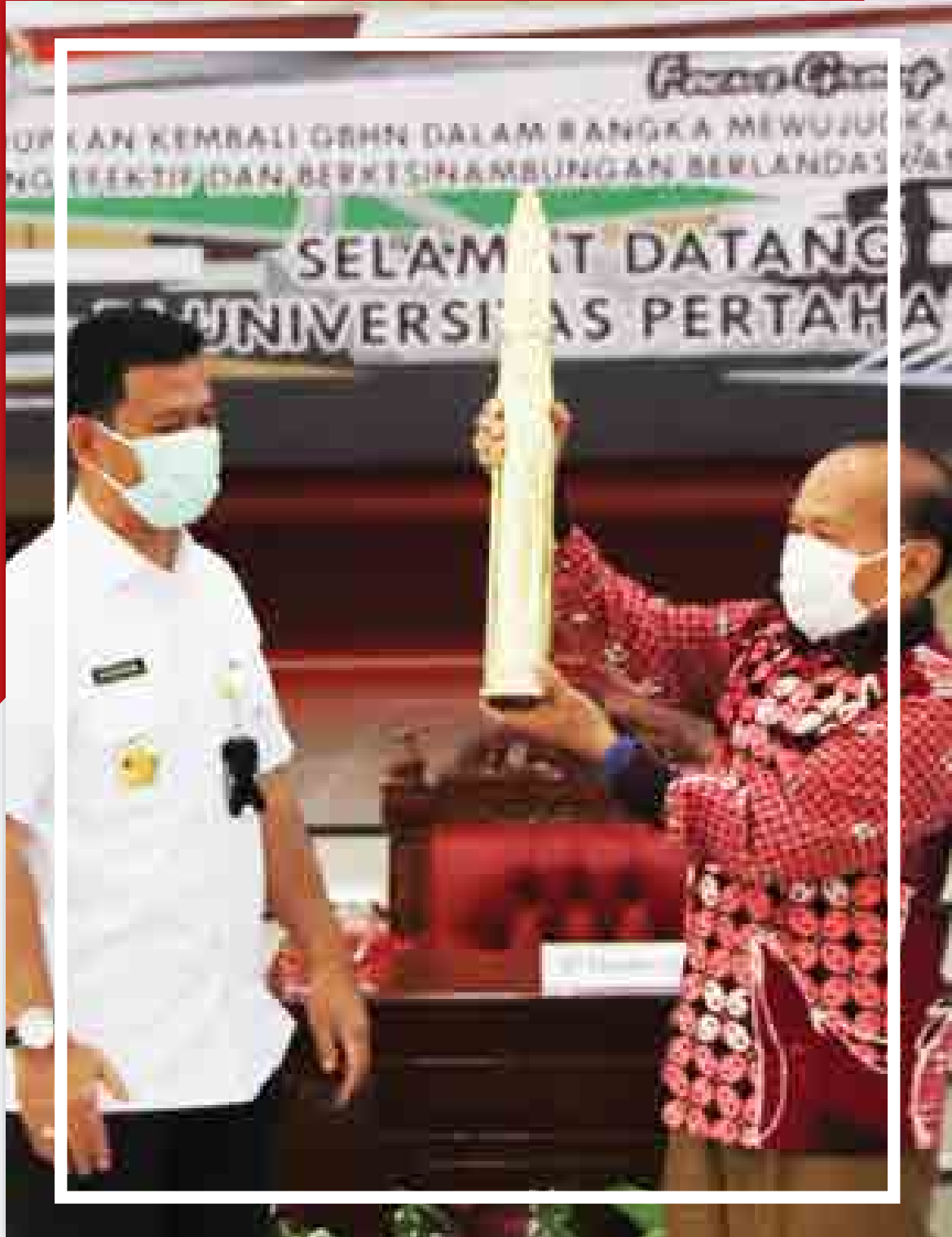
Unhan Bersama MPR RI Menyelenggarakan Focus Group Discussion (FGD) tentang GBHN