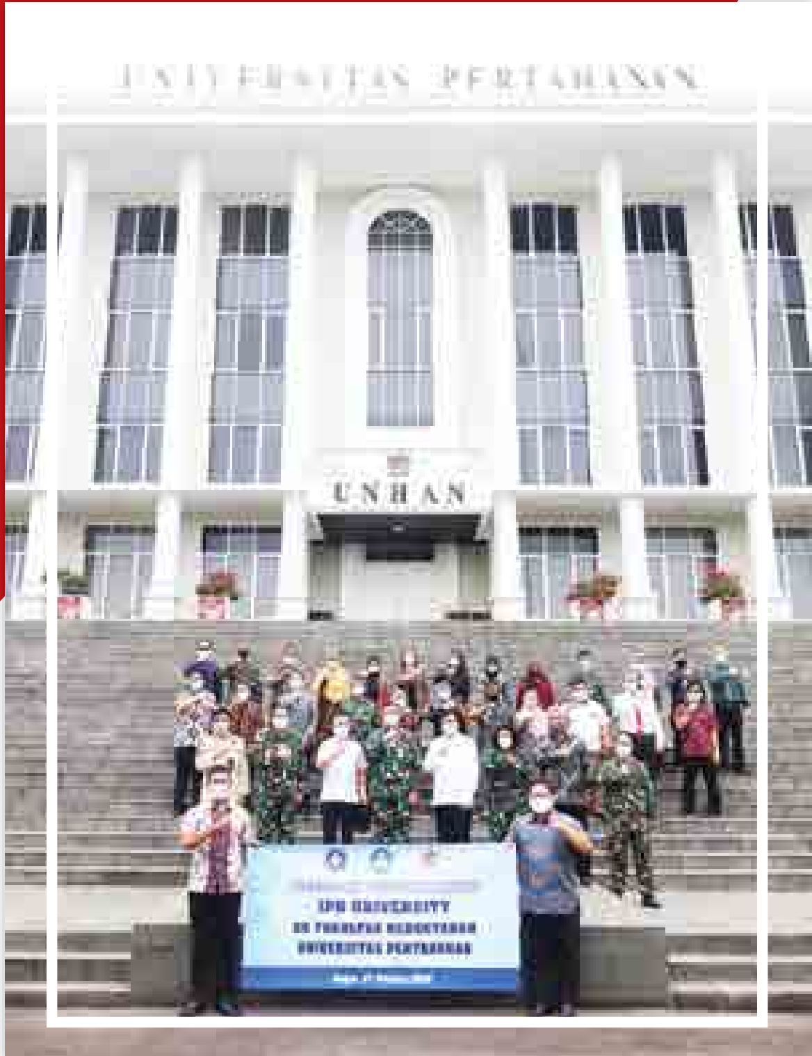
Unhan Aktif Menjalin Kerjasama dengan Perguruan Tinggi/ Lembaga Lain