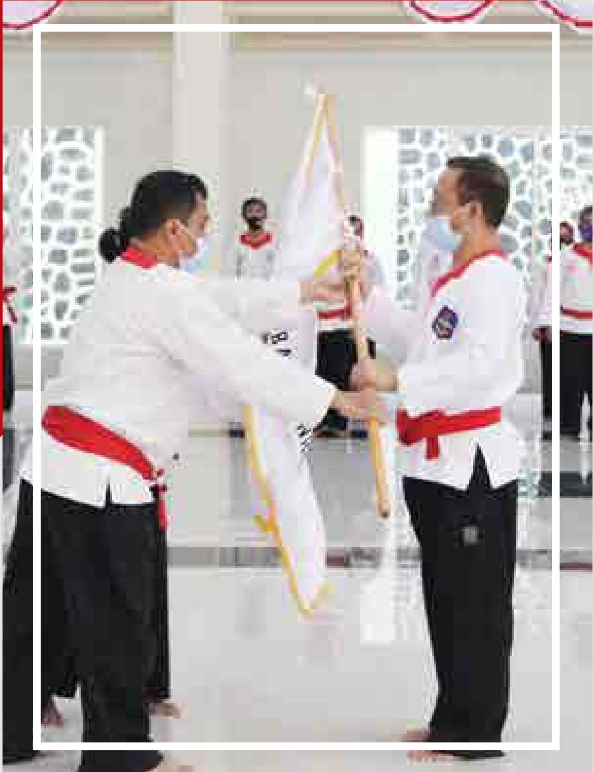
Pelantikan Pengurus Kolat Silat Merpati Putih Cabang Khusus Universitas Pertahanan