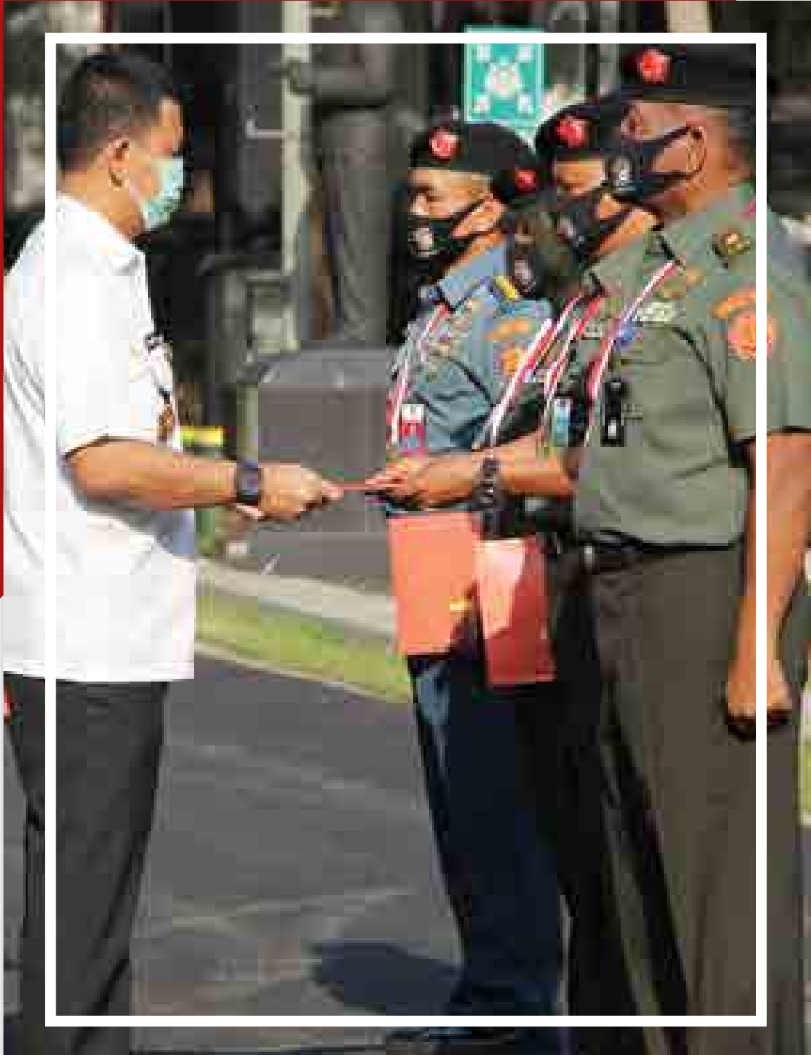
Rektor Unhan Berikan Penghargaan Atas Capaian Akreditasi “Unggul” Tiga Prodi FSP Unhan dan Juara Umum POR Kemhan