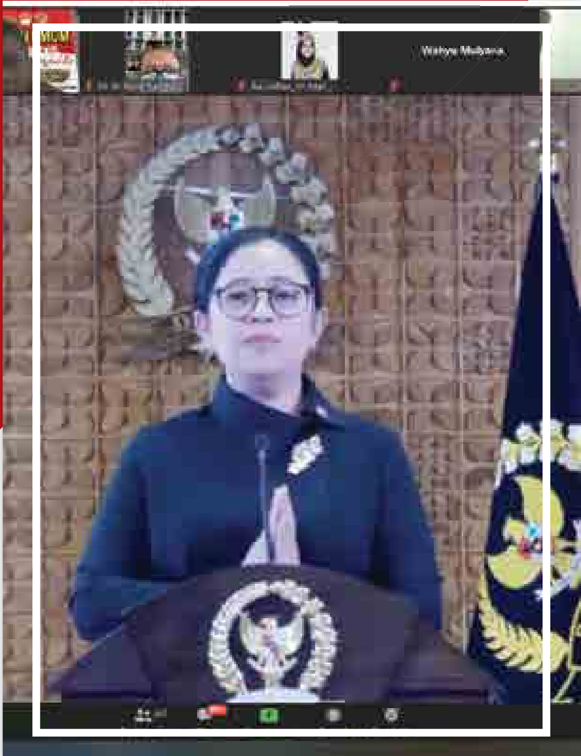
Mahasiswa Unhan Menerima Kuliah Umum dari Ketua DPR RI Dr. (H.C.) Puan Maharani dan Menteri Perindustrian RI